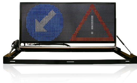
Berghaus MobiLED 80 x 32 px RGB Fullcolor